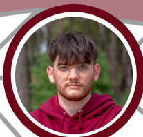
COM LOGISTIQUE Thomas Marine